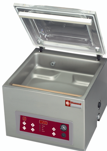
Avec option Advanced Control System (ACS)